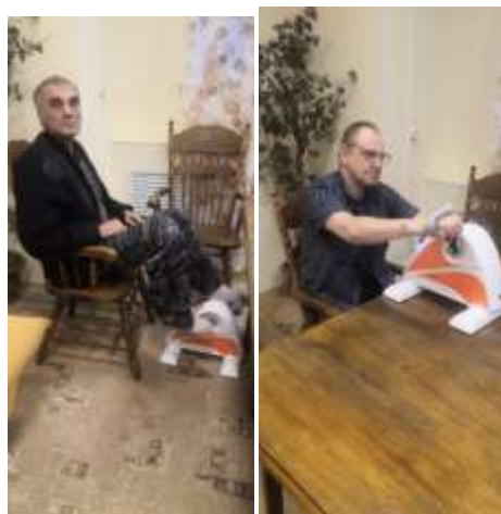
сенсорные игры. Беговая дорожка.