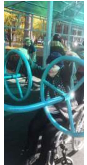
развивающих занятий укрепления мышц.